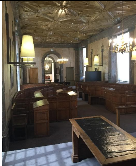
Salle de Tribunal