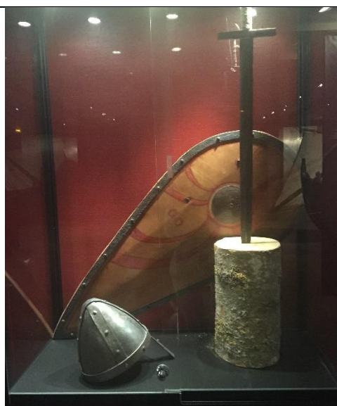
Eléments d'une armure