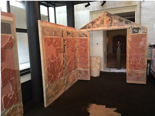
Morceaux retrouvés d'une maison